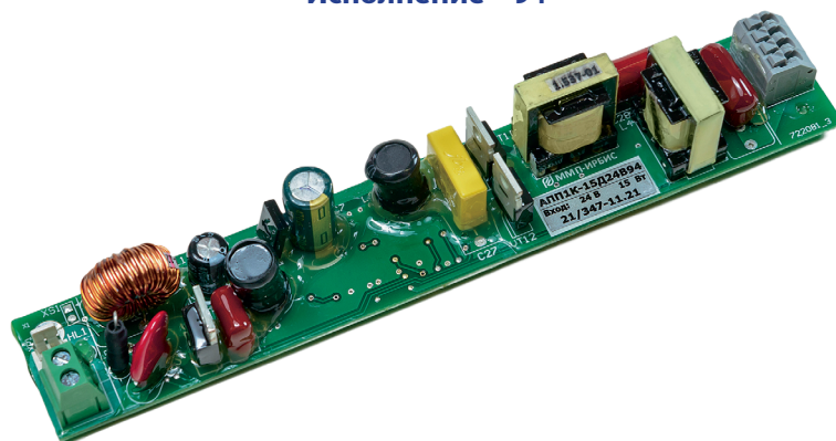
Исполнение – 94